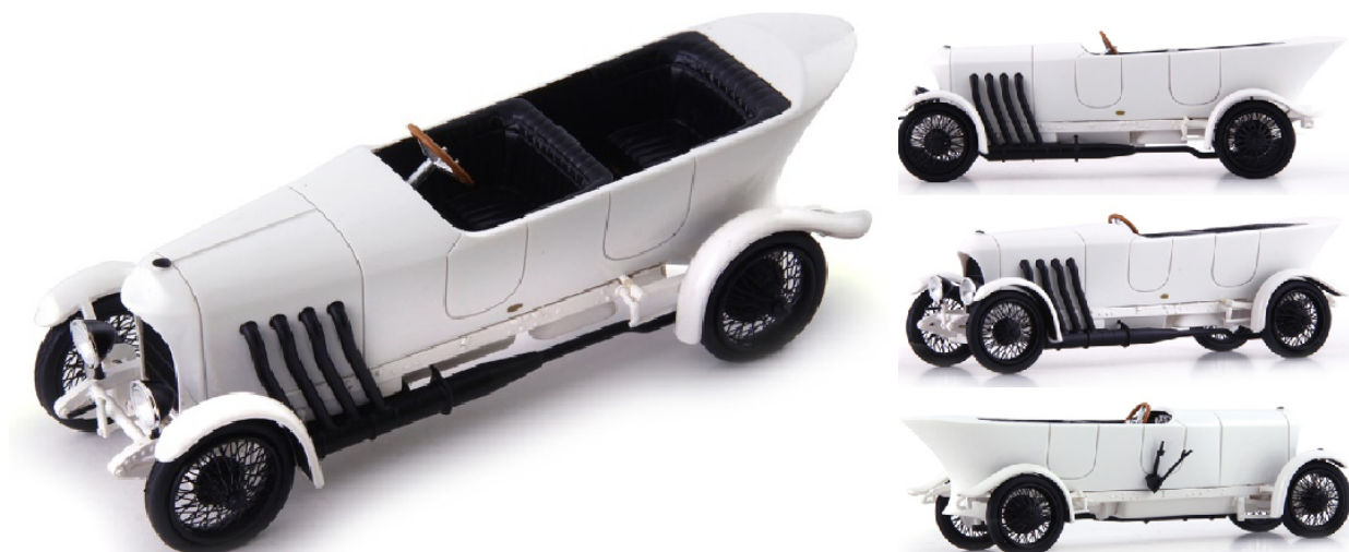
ATC 01022 Austro Daimler 22/86 PS Spezial „Prince of Elias of Parma“ (Österreich, 1909) € 113,95