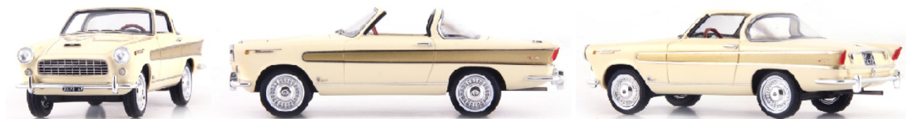
ATC 05049 Fiat 1200 Vignale Wonderful (Italien, 1957)

Es ist nicht gesichert, ob die Idee zu der sehr extravaganten Blechhaut auf seine eigenen Vorstellungen zurückging oder das Angebot eines vermeintlichen Experten war. In seiner Form von den damals bekannten Linien weit abweichend, betonten harte Kanten und Ecken die leicht zum Fahrzeugende hochlaufende Form. Erwähnenswert sind zudem die direkt über den Reifen platzierten Kotflügel, wobei vor allem die beiden hinteren schwungvoll ausliefen. Mit Platz im Innenraum für vier Passagiere tendierte der Aufbau zum luxuriösen Segment, auch wenn die aus der Fahrzeugseite herausragenden Auspuffrohre Sportlichkeit widerspiegeln. Vielleicht war es aber genau jene Mischung aus Noblesse und Leistungsfähigkeit, die der Adelige mit seinem Unikat zeigen wollte. Man wird es nie erfahren – das Auto hat die Zeit auch nicht überlebt.