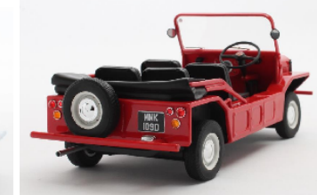
CML109-1 Mini Moke (1965) grün € 189,95 CML109-2 Mini Moke (1965) blau € 189,95 CML109-3 Mini Moke (1965) rot € 189,95