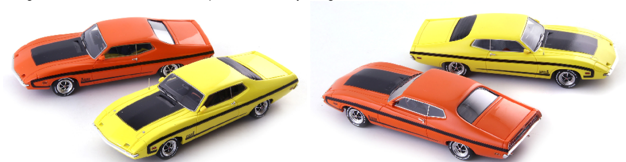
A43 60094 Ford Torino King Cobra (USA, 1970) orange € 113,95 A43 60095 Ford Torino King Cobra (USA, 1970) gelb € 113,95

1951 traten beim 'Großen Preis von Großbritannien', dem fünften Formel 1 Lauf, die beiden Fahrer Reg Parnell und Peter Walker an. Der schon 40jährige Parnell brachte seinen Wagen auf Rang fünf - mit fünf Runden Abstand zum Sieger - und sein Teamkollege auf Rang sieben - dem letzten Platz - ins Ziel. Reg Parnell bekam durch sein Endergebnis zwei WM-Zähler auf sein Konto. Dies blieben die einzigen beiden Zähler, die ein BRM je einfuhr! Die erfolglose Episode des BRM dauerte noch bis in die Saison 1954 an. Für das Scheitern des Projektes wurden letztlich mehrere Gründe verantwortlich gemacht. Die Vielzahl der beteiligten Unternehmen und eine unkoordinierte Zusammenarbeit führten beispielsweise keineswegs zu der erhofften Konzentration an Fachwissen. Dieser Punkt galt als das größte Manko, aber auch die Komplexität des 16-zylindrigen Motors brachte das Team an seine Grenzen.