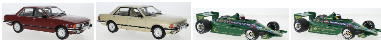
MCG 18401 Ford Granada MK II 2.8 Ghia 1982 dunkelrot metallic € 64,95 MCG 18402 Ford Granada MK II 2.8 Ghia 1982 beige metallic € 64,95 MCG 18620F Lotus Ford 79 # 1 John Player Team GP Argentinien 1979 M.Andretti € 64,95 MCG 18621F Lotus Ford 79 # 2 John Player Team GP Argentinien 1979 C.Reutemann € 64,95