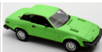
CML115-1 Triumph TR7 Coupe (1979-1982) rot € 189,95 CML115-2 Triumph TR7 Coupe (1979-1982) gelb € 189,95 CML115-3 Triumph TR7 Coupe (1979-1982) grün € 189,95