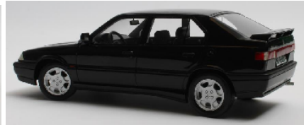
CML136-1 Alfa Romeo 33 QV Permanent 4 (1991) rot € 189,95 CML136-2 Alfa Romeo 33 QV Permanent 4 (1991) schwarz € 189,95