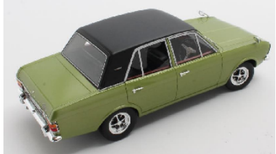
CML048-2 Ford Cortina 1600E grün metallic € 189,95