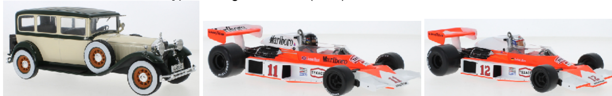
MCG 18410 Mercedes Typ Nürburg 460/460 K (W08) 1928 beige/dunkelgrün € 69,95 MCG 18612F McLaren M23 # 11 Marlboro Team McLaren GP Frankreich 1976 J. Hunt € 64,95 MCG 18613F McLaren M23 # 12 Marlboro Team McLaren GP Deutschland 1976 J. Maas € 64,95