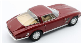
CML086-2 ISO Grifo (1965) rot metallic € 189,95