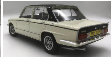
CML021-2 Triumph Dolomite Sprint (1973) blau € 189,95 CML021-3 Triumph Dolomite Sprint (1973) dunkelrot € 189,95 CML021-4 Triumph Dolomite Sprint (1973) weiss € 189,95