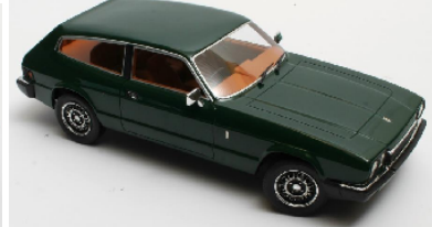
CML135-1 Reliant Scimitar SE6A (1976) beige € 189,95 CML135-2 Reliant Scimitar SE6A (1976) grün € 189,95