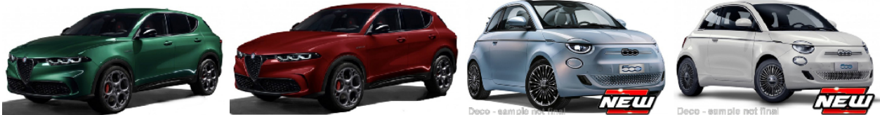
BBU18-21109G Alfa Romeo Tonale grün