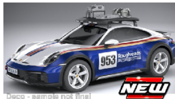
BBU18-28029 Porsche 911 (992) Dakar 2023