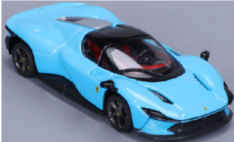
BBU18-16912B Ferrari Daytona SP3 hellblau / schwarz