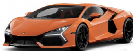
BBU18-21106O Lamborghini Revuelto orange metallic